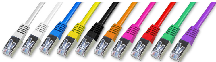
C6 FTP blindé

Cordons RJ45 catégorie 6 100% Cuivre S/FTP - double blindage