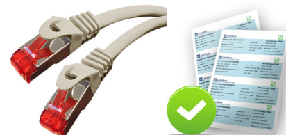
Fiche de test

Manchons anti accroc (snagless) et livrés avec fiche de test